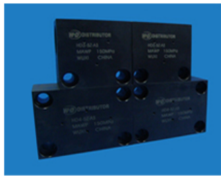
最大工作压力: 450MPa 可按客户要求定制非标螺纹

超高压液体分配器是超高压液压系统中广泛使用的元件之一，其作用是液体的分流或汇集。当液压回路中的液体需要流向多个支路或从多个支路汇总时就要使用它，威海达生产的分配器选用超高强度合金钢或不锈钢，经过探伤、严格的热处理、高精度加工等一系列复杂工艺制造而成，其使用性能媲美美国外同等产品，良好的性价比获得市场的一致好评。